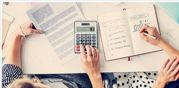
Юридические консультации и ведение бухгалтерии