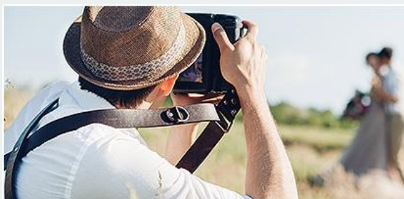
Фото- и видеосъемка на заказ