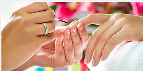
Оказание косметических услуг на дому