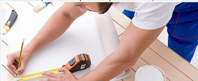
Строительные работы и ремонт помещений

Налог на профессиональный доход можно платить и при осуществлении других видов деятельности, если соблюдаются все условия, предусмотренные Федеральным законом № 422-ФЗ.