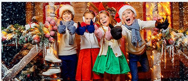
Проведение мероприятий и праздников