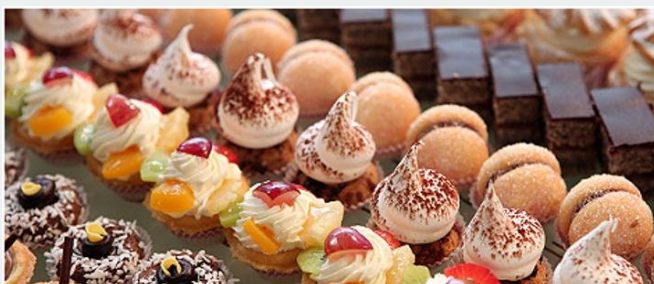
Продажа продукции собственного производства