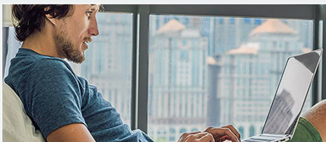
Удаленная работа через электронные площадки